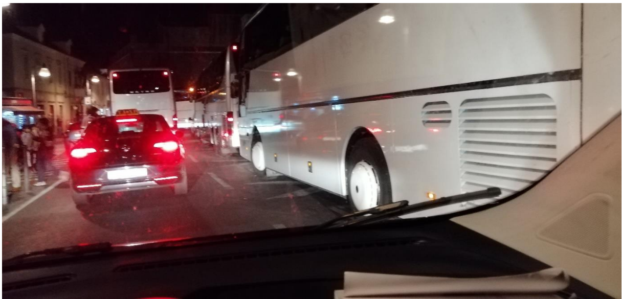
Prilog 2. Anomalije na ulici Frana Supila